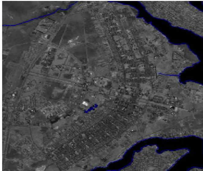
Figura 2. Imagem registrada sob mapa temático de rios.