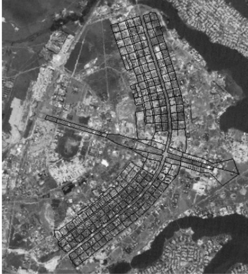
Figura 3 – composição da imagem registrada com os mapas