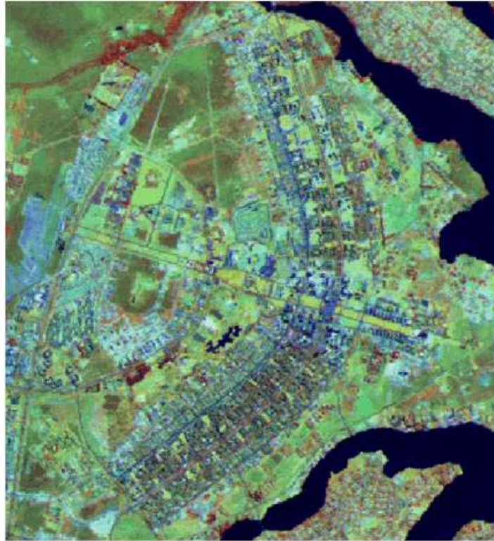
Figura 1 – cidade de Brasília

Abaixo são apresentados os principais passos para o registro da imagem TM/Landsat da cidade de Brasília.