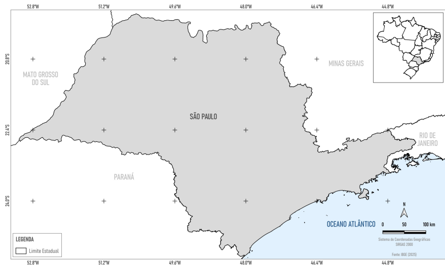
Figura 1. Mapa de Localização da Área de Estudo